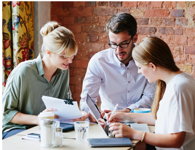
FinancialForce hilft Ihnen, den Ressourcenprozess frühzeitig im Customer Journey einzuleiten.

Das Ressourcenmanagement sollte eine kollaborative Aktivität sein. Versetzen Sie Ihre Mitarbeiter und Teammitglieder in die Lage, eine zentralere Rolle zu übernehmen, indem Sie die Fähigkeitsziele identifizieren und Interesse an einer Arbeit zeigen, die sie motiviert. FinancialForce hilft Ihren Teammitgliedern sogar dabei, ihre Fähigkeiten basierend auf früheren Aufgaben anhand von Erinnerungen an die nächstbeste Aktion auf dem neuesten Stand zu halten. Dadurch gewinnen die Mitarbeiter mehr Einfluss auf den Planungsprozess und können den Fortschritt ihrer eigenen Karriere mitgestalten.